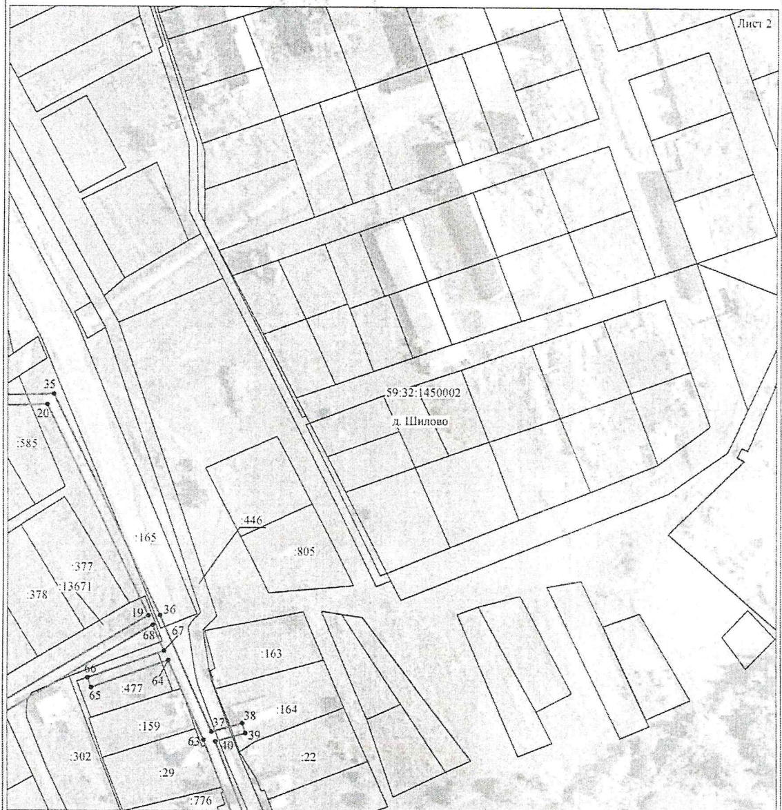
Схема расположения границ публичного сервитута объекта